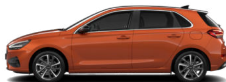
Jupiter Orange Metallic