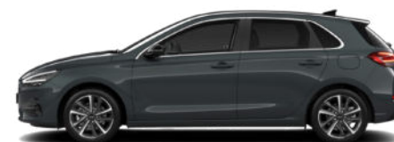
Cypress Green Pearl