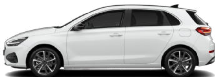
Serenity White Pearl