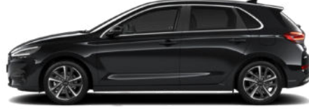
Abyss Black Pearl