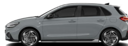
Shadow Grey nur für N Line