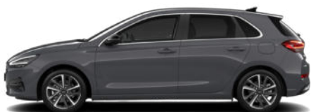
Ecotronic Grey Pearl