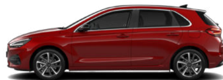
Ultimate Red Metallic