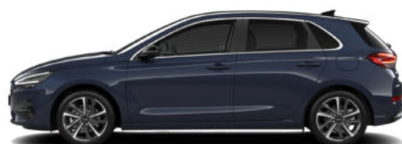
Sailing Blue Pearl