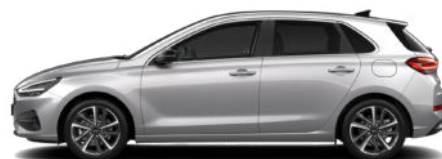
Shimmering Silver Metallic