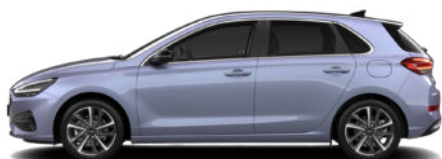
Meta Blue Pearl