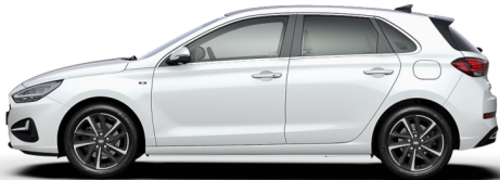
Serenity White Pearl