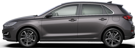
Dark Knight Gray Pearl