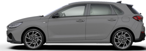
Shadow Gray nur für N Line