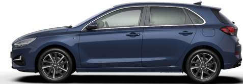
Dark Teal Metallic