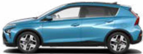
Aqua Turquoise Metallic*