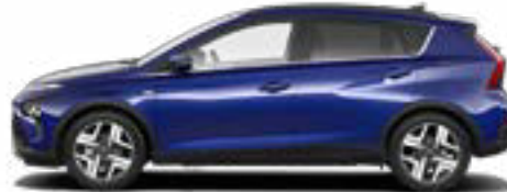
Intense Blue Pearl Kontrastdach verfügbar