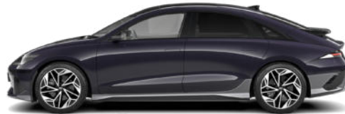
Biophilic Blue Pearl