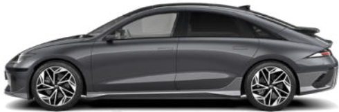
Nocturne Gray Metallic