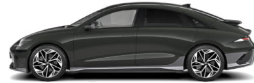
Digital Green Pearl