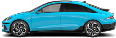
Byte Blue Pearl