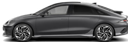
Nocturne Gray Matte

Pflegehinweis bei Fahrzeugen mit Mattlackierung: Autowaschanlagen mit drehenden Bürsten dürfen nicht verwendet werden, da sie die Oberfläche Ihres Fahrzeugs beschädigen können. Dampfreiniger, die die Fahrzeugoberfläche mit hohen Temperaturen reinigen, können dazu führen, dass Öl auf dem Lack haftet und schwer zu entfernende Flecken bildet. Verwenden Sie bei der Autowäsche ein weiches Tuch (z. B. Mikrofaser Tuch oder Schwamm) und trocknen Sie das Auto mit einem Mikrofaser Tuch. Wenn Sie Ihr Auto von Hand waschen, sollten Sie keinen Reiniger verwenden, der mit einer Wachsbehandlung abschließt. Wenn die Fahrzeugoberfläche stark verschmutzt ist (Sand, Schmutz, Staub, Verunreinigungen usw.), spülen Sie die Oberfläche zunächst mit Wasser, bevor Sie das Fahrzeug waschen. Verwenden Sie keinen Lackschutz (wie Schaumwaschmittel), Scheuermittel oder Politur. Wurde Wachs aufgetragen, entfernen Sie das Wachs umgehend mit einem Silikonreiniger. Wenn Teer oder Teerverunreinigungen vorliegen, verwenden Sie zu deren Entfernung einen geeigneten Teerentferner. Achten Sie jedoch darauf, nicht zu viel Druck auf die Lackierung auszuüben.