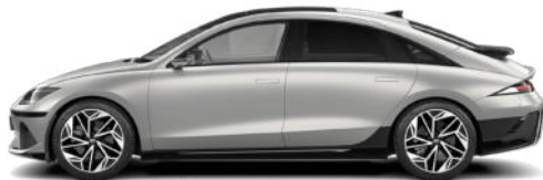
Gravity Gold Matte