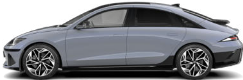
Transmission Blue Pearl