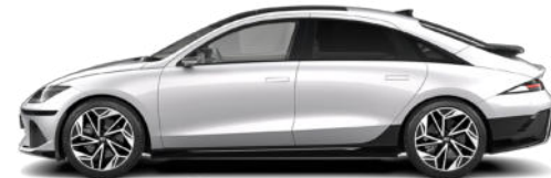
Curated Silver Metallic